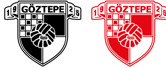
Tek Renk Erkek Kullanım