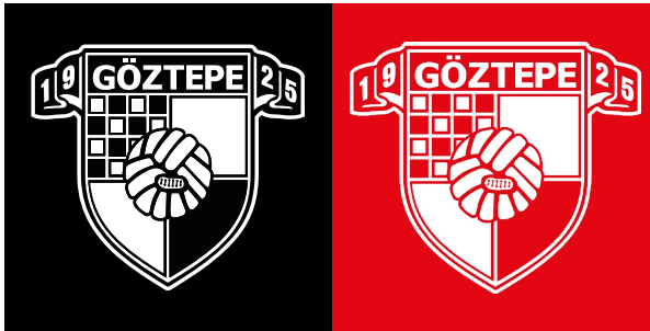
Tek Renk Dişi Kullanım